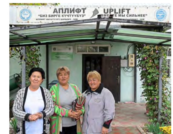
Mittlerweile hat der Verein ein eigenes Haus ...