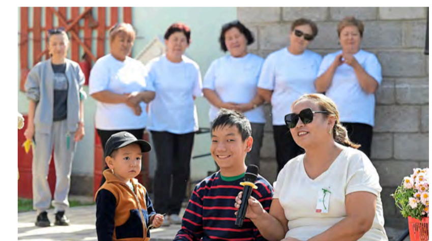
... und ein Team von 40 Mitarbeiterinnen.