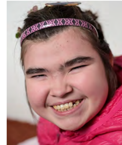
Alle sollen sich wohlfühlen.

Der Ansatz, Lerngruppen zu bilden, wie Uplift es erstmals vor über zehn Jahren praktizierte, wird inzwischen