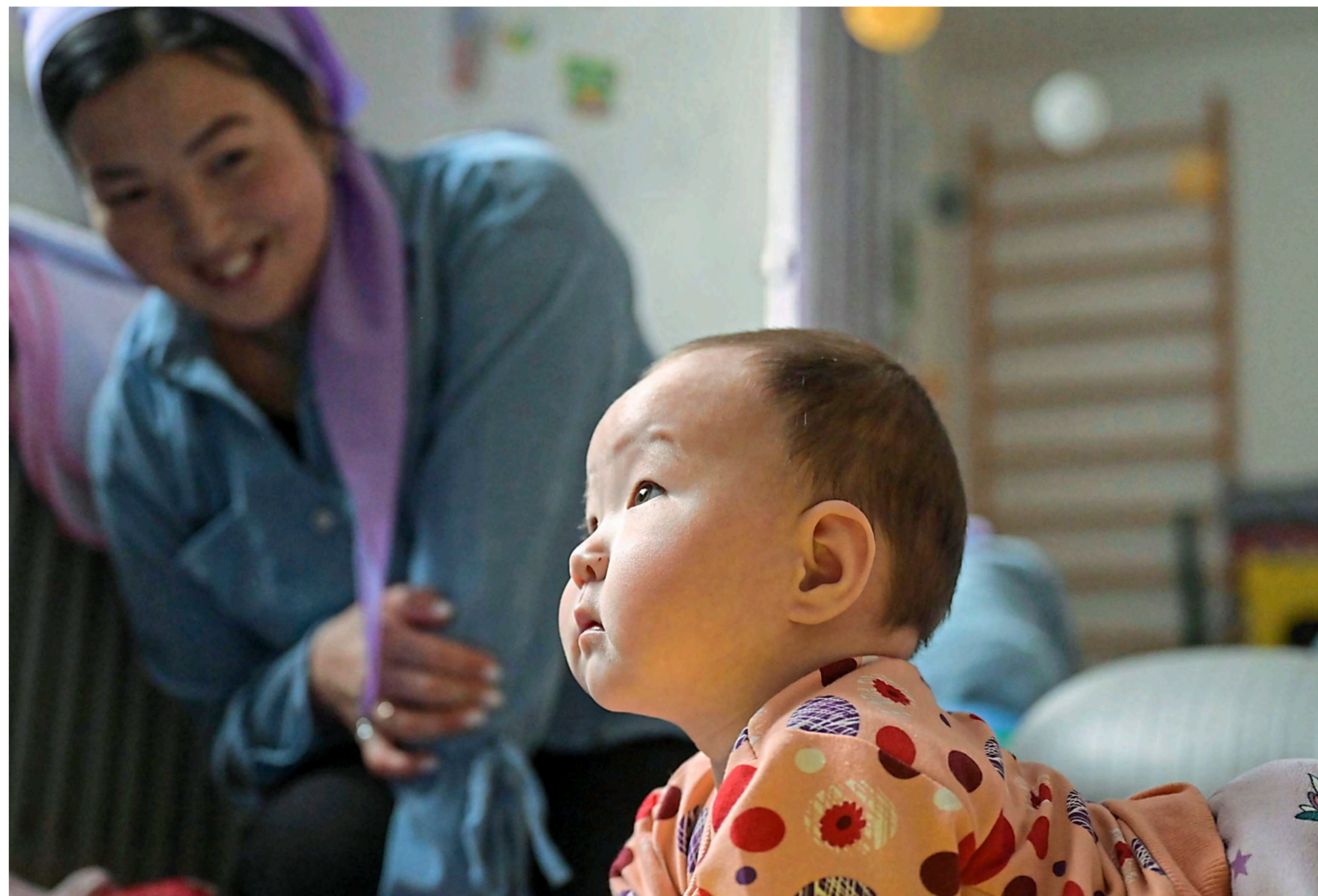
Im ganzen Land findet die Arbeit von Uplift inzwischen wohlwollende Anerkennung.