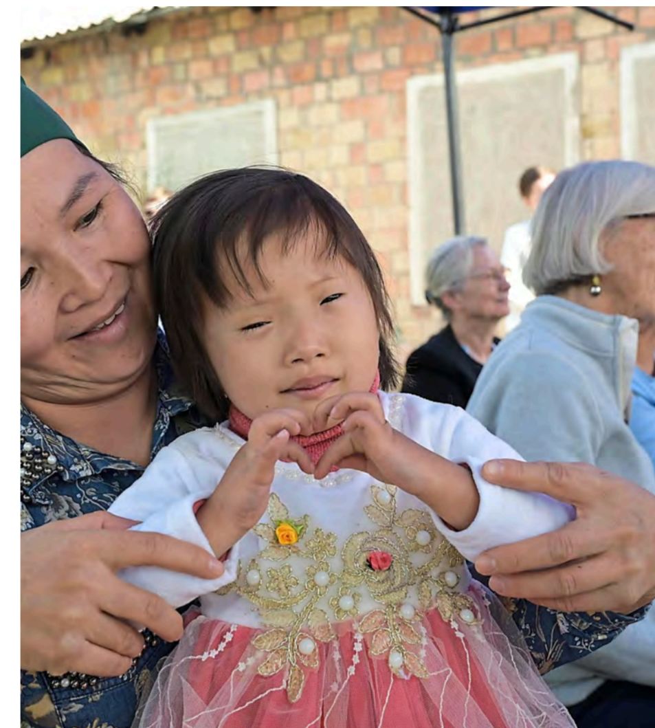
Die Mitarbeit der Eltern ist enorm wichtig.