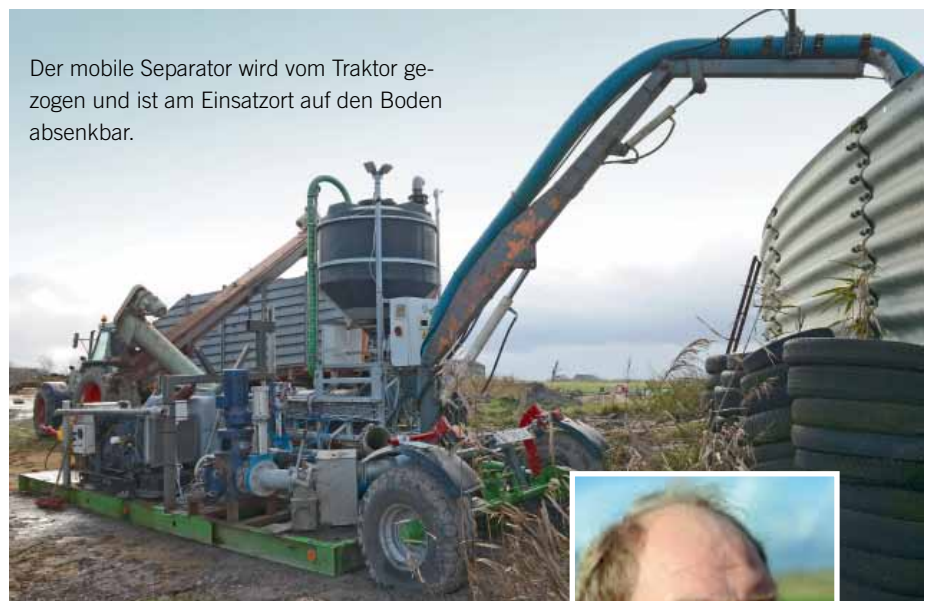
Der mobile Separator wird vom Traktor gezogen und ist am Einsatzort auf den Boden absenkbar.

Um aber separierte Gülle einsetzen zu können, musste die Anlagentechnik umgebaut werden. So funktionierte man den Behälter, der ursprünglich nur als Zwischenlager für Gülle gedacht war, zu einem Fermenter um. Damit stehen für den Gärprozess nun zwei statt wie früher nur ein Fermenter zur Verfügung. Das hat zwei wesentliche Vorteile: Zum einen verlängert man die Verweilzeit des Substrats, wodurch die Gasausbeute pro Kubikmeter eingesetzter Biomasse deutlich erhöht wird. Früher war die Verweilzeit des Gärsubstrats auf 60 Tage begrenzt, nun sind 100 Tage möglich.